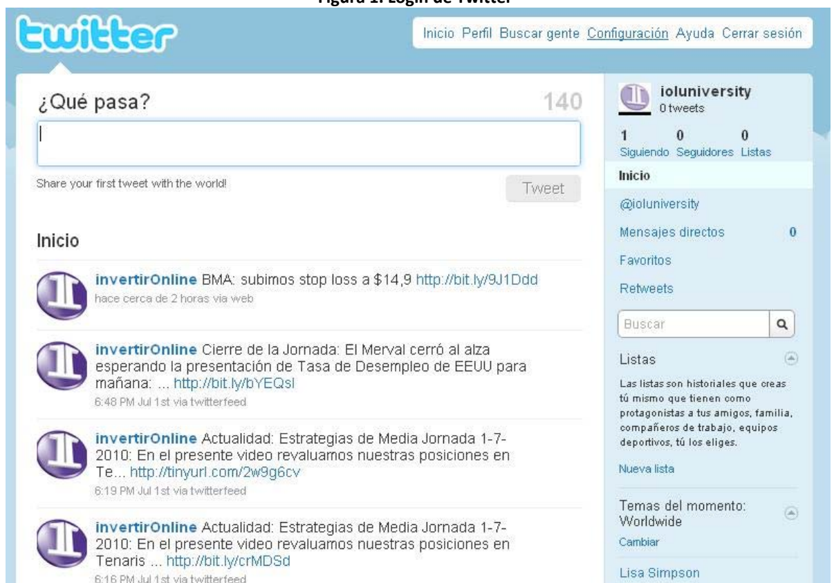
Figura 1. Login de Twitter

Luego de ingresar con su usuario y contraseña de Twitter, deberá buscar a InvertirOnline y seguirlo para poder recibir sus noticias, alarmas y mensajes ( tweets ). Una vez incorporado a InvertirOnline dentro de sus contactos a seguir, debe ingresar a Configuración de su Cuenta (al tope derecho de la pantalla).