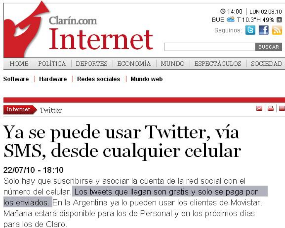
Figura 5. Servicio Gratuito de recepción de SMS desde Twitter (Clarín, 22 de Julio de 2010)

Podrás responder la alerta opinando acerca de tu visión de mercado o consultando otros temas de tu interés.