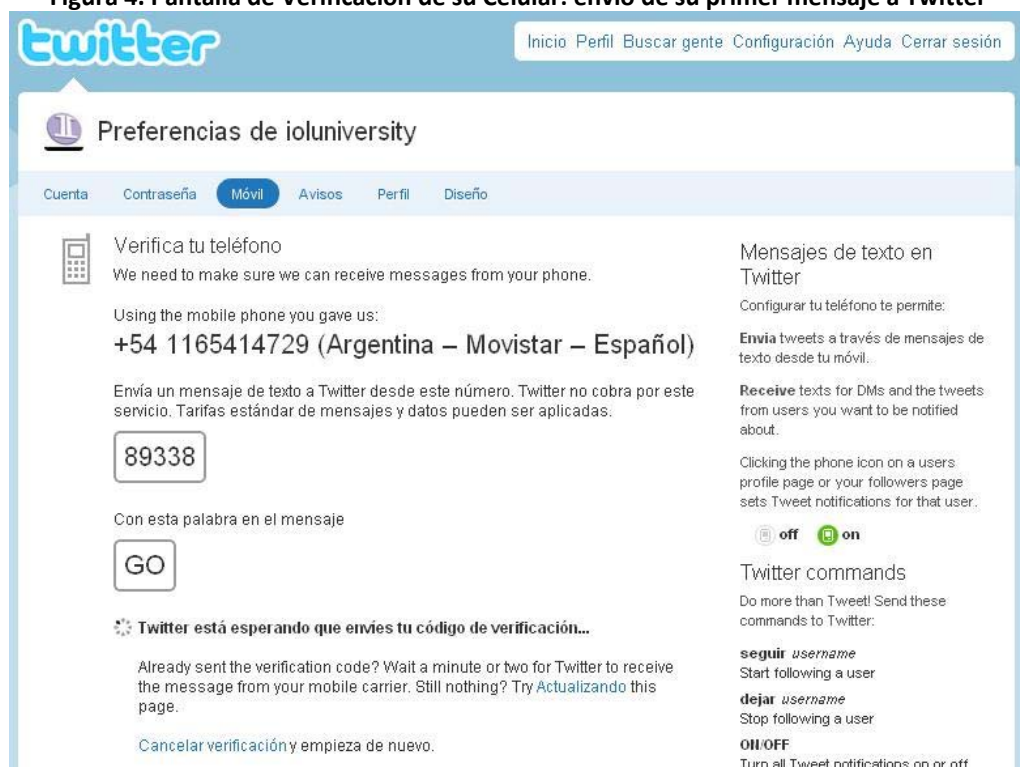
Figura 4. Pantalla de Verificación de su Celular: envío de su primer mensaje a Twitter